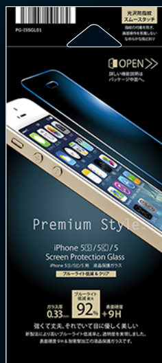
パッケージイメージ