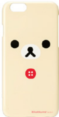
コリラクマ フェイス