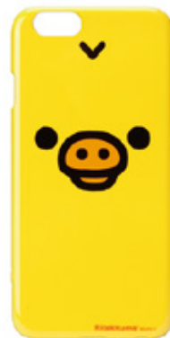
キョリトリ フェイス