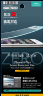
パッケージイメージ