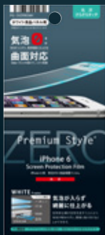
パッケージイメージ