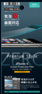
パッケージイメージ