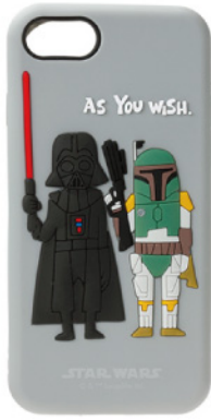
ダース・ベイダー