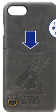
ダース・ベイダー