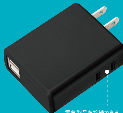
電気製品を接続できる コンセント1口搭載