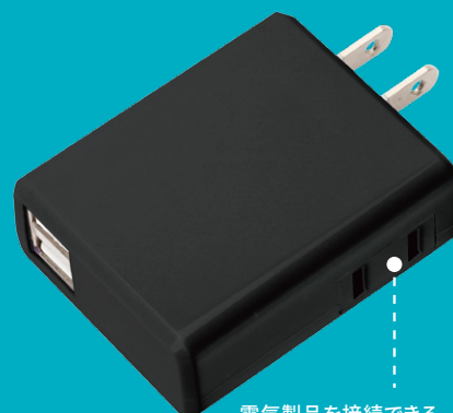
電気製品を接続できる コンセント1口搭載