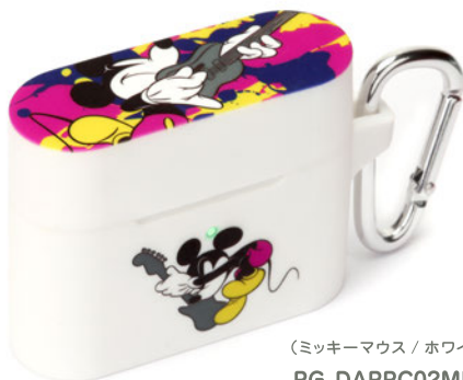
(ミッキー・マウス / ホワイト) PG-DAPPC02MKY 4 562358 118098