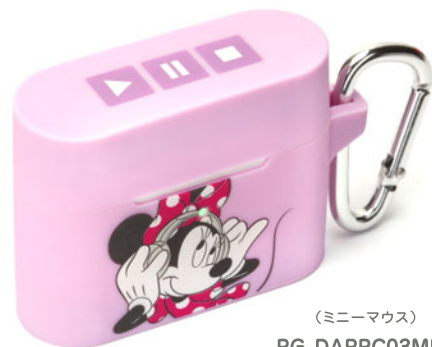
(ミニーマウス) PG-DAPPC03MNE 4 562358 118104