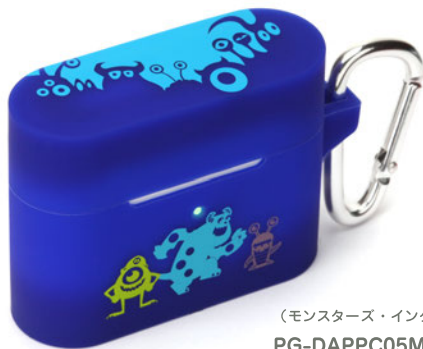
(モンスターズ・インク) PG-DAPPC05MOI 4 562358 118128