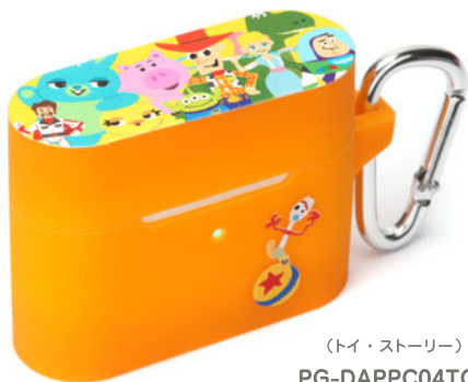
(トイ・ストーリー) PG-DAPPC04TOY 4 562358 118111