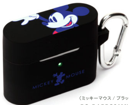
(ミッキー・マウス / ブラック) PG-DAPPC01MKY 4 562358 118081